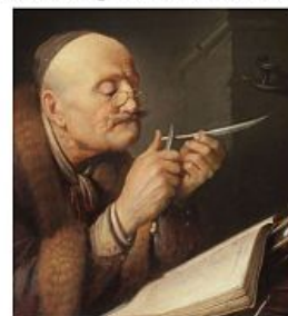
© Gerrit Dou: Geleerde die zijn pen snijdt. 1630-1635 / public domain (Ausschnitt)

When someone starts an argument with me about something I know a lot about