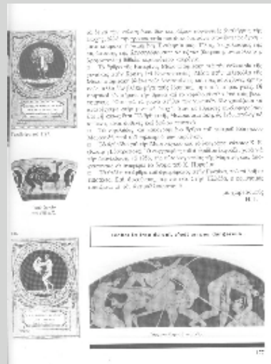
δείγμα σελίδας δεξιά

Όλα αυτά δε σημαίνουν απαραίτητα ότι ο Πετρόπουλος μοιράζει εντελώς τυχαία το υλικό του. Μάλλον ότι επιτρέπει στο γράψιμό του (και στην εικονογράφηση) τα συνειρμικά άλματα γύρω από έναν θεματικό πυρήνα : την σχέση κοινωνίας και σεξουαλικότητας. Αυτό που επανέρχεται είναι όχι τόσο πολύ η πληροφορία για συγκεκριμένα πράγματα και πρακτικές, αλλά ορισμένα